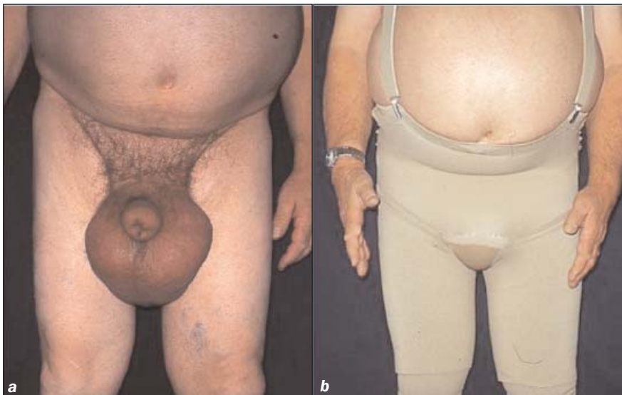
Abb. 6 Sekundäres Genitallymphödem vor der KPE Behandlung (a). Nach Behandlung mit individuell angepasster Flachstickstrumpfhose/Bermuda (b)

drisch eingesetzt werden, gepolstert. Durch diese vom Therapeuten mit Tapeband kaschierten Materialien (beispielsweise Rosidal® soft) werden auch höhere Drücke durch die Verwendung der elastischen Mullbinden gleichmäßig verteilt. Ein lymphologischer Kompressionsverband, gleich in welcher Region angelegt, darf nie Parästhesien oder Schmerzen verursachen (15).